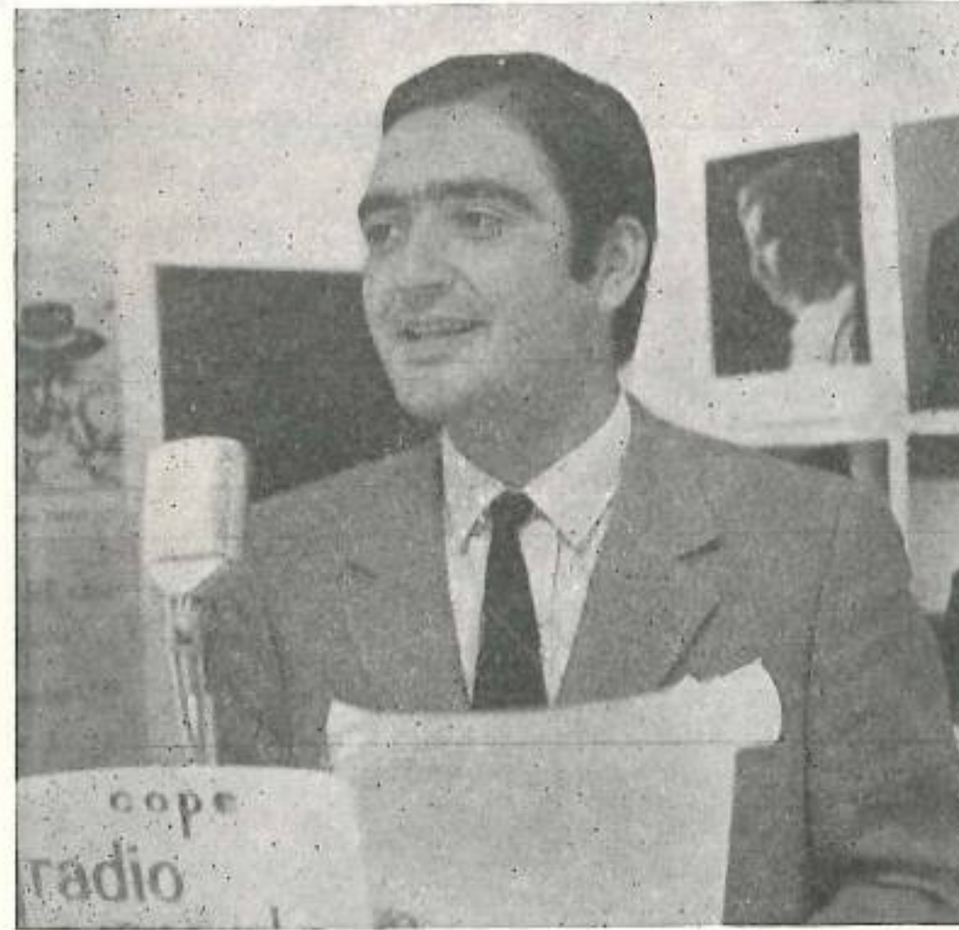
celebrado ya tres ediciones.

Es promotor de diversos cine clubs en distintas poblaciones de la provincia, Rota, Trebujena, Puerto de Santa María, San José del Valle, donde ha estado presente con cursos cinematográficos, sesiones de cine fórum, conferencias, ponencias cinematográficas, etc. Asimismo es director del Aula de cinematografía del Ateneo de Jerez.